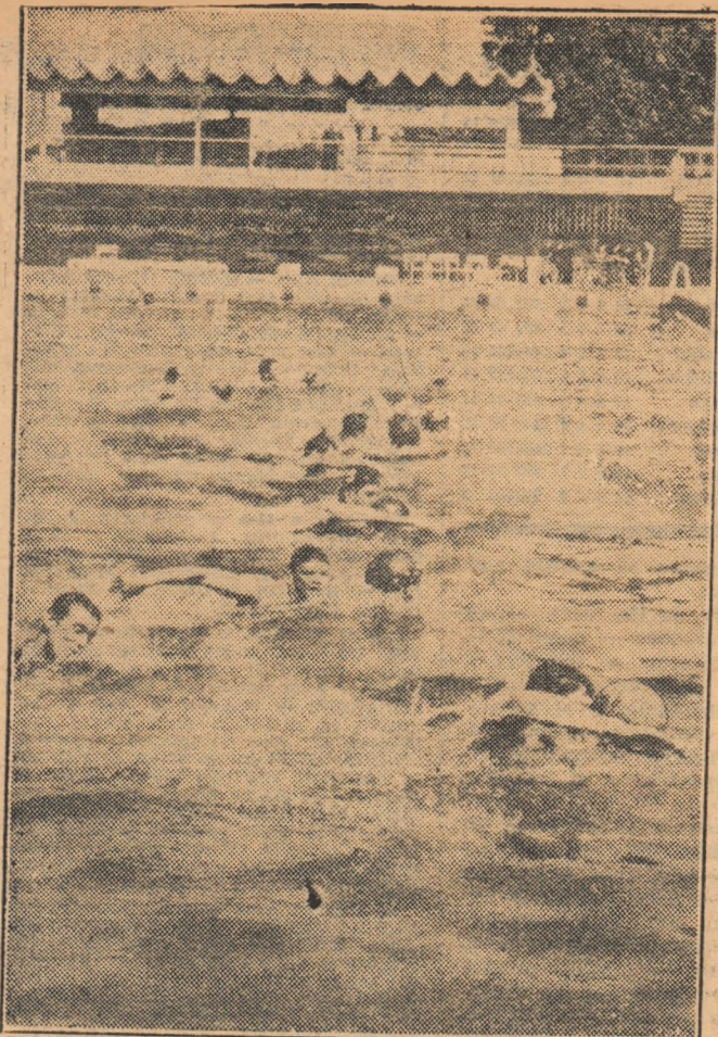
In elegantul bazin de inot din incinta stadionului Dinamo se desfășoară în această perioadă antrenamentele lotului național de polo. In imagine: cei mai buni jucători de polo ai țării noastre în timpul unui antrenament de conducere a balonului.

ORGAN AL UNIUNII DE CULTURĂ FIZICĂ ȘI SPORT DIN REPUBLICA SOCIALISTĂ ROMÂNIA