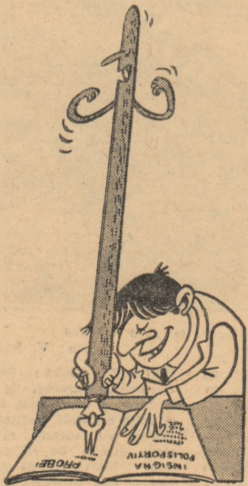
TOCUL: — Bravo mie! Eu iau toate probele.