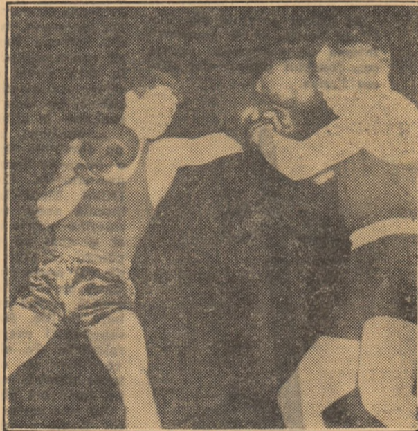
Pometa (stînga), la pînă ofensivă