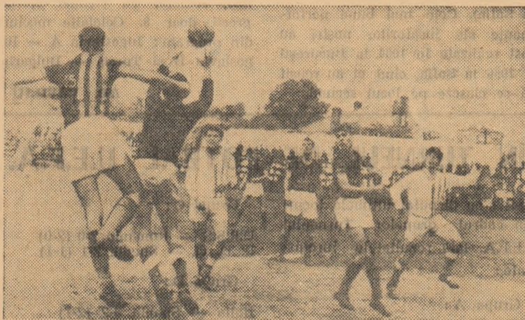
Fază din meciul Flacăra roșie București—Electrica Fieni.

I.M.U. MEDGIDIA — PROGRESUL CORABIA 4-0 (2-0). Echipa locală a dominat mai mult și a obținut pe merit această victorie la scor. Au marcat: Călin (min. 35), Bășchir (min. 39), Mădăche (min. 55) și Cătrila (min. 80). Bun arbitrajul lui G. Dragomir. (Radu Avram, coresp.).