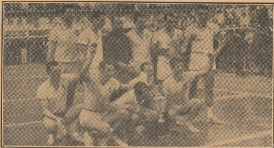
Jucătorii și antrenorul echipei Dinamo — câștigătoare pentru a doua oară consecutiv a „Cupei campionilor europeni”

Dinamo București a cucerit trofeul pentru a doua oară consecutiv