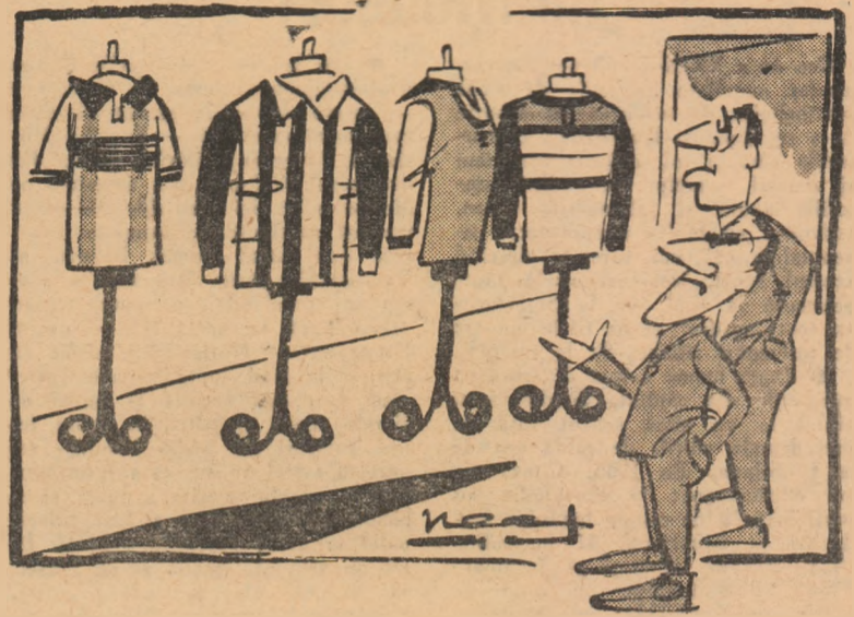
— Crezi că spectatorii își vor da seama că sîntem echipa Fulgerul? — După tricouri, nu. După felul cum jucăm, însă, s-ar putea să ne recunoască! (Desen de Neagu Rădulescu)

Dar, în legătură cu echipamentul, în timpul din urmă s-a ivit și un alt aspect, acela al „colorilor” clubului. Dacă depășind amintiri cu un vechi iubitor al fotbalului te vei referi la „vișnii” sau la „negri”, acesta va ști că este vorba de Rapid și, respectiv, Venus. Pînă mai acum cîțiva ani, dacă pomeneai de „roș-albaștri”, nici o confuzie nu era posibilă: era vorba de C.C.A. De la o vreme însă, nimeni nu-ți mai