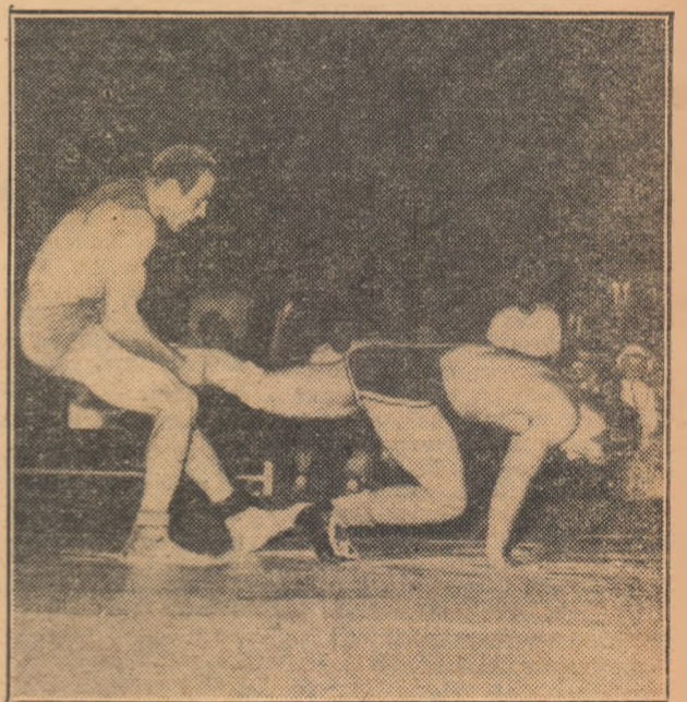
Un „atac la picior” executat la un meci internațional de lupte libere de către Fr. Bola