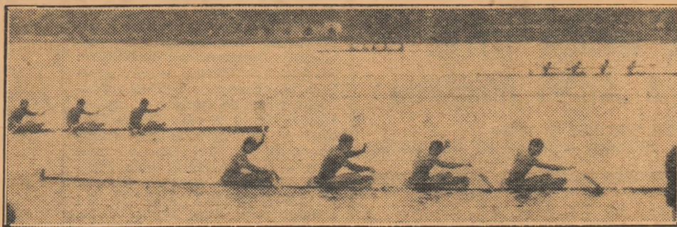
Moment din întrecerea echipelor de caiac 4