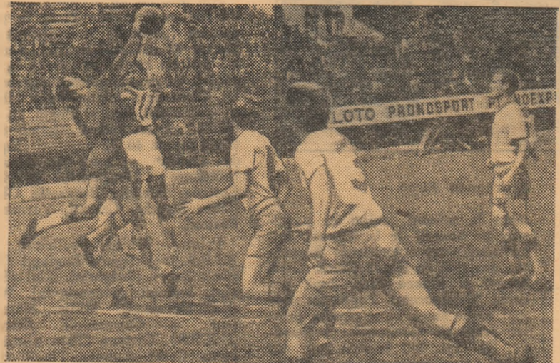
Fază din meciul Rapid C.F. București-S.N. Oltenița (3-1)

AUTORAPID CRAIOVA — AURUL ZLATNA (3-1). Terenul desfundat a cerut eforturi deosebite din partea ambelor echipe. Craiovenii au terminat învingători prin golurile înscrise de Dașcu (min. 20 și min. 80, ulti-