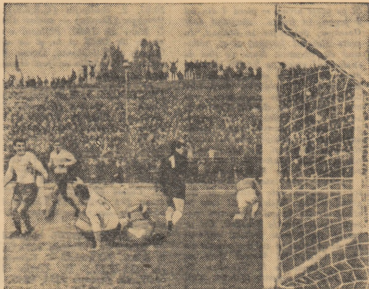
Echipa României a înscris primul gol. Bucurie pe fețele jucătorilor noștri, dezamăgirea pe cele ale elvețienilor. (Fază din meciul România — Elveția 4-2)

namentul a avut loc pe un teren lăturalnic. Pe stadionul Hardturn, unde se desfășoară partida miercuri seara (cu începere de la ora 21, ora României) am făcut doar o plimbare amănunțită sub lumina reflectoarelor, fiecare component al echipei cercetând cu atenție eventuala zonă în care va acționa. Terenul de joc se prezenta în bune condiții. Scriu se prezenta, deoarece în dimineața zilei de marți ploua, vremea era închisă și se pare că va rămâne așa timp de 3-4 zile!