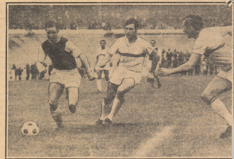
În meciul Stade de Paris-Reims, publicul parizian a avut prilejul să-l urmărească pentru ultima oară pe Raymond Kopa. Celebru fotbalist (stînga) și-a anunțat oficial retragerea la sfîrșitul sezonului.

● Echipa braziliană Flamengo Rio de Janeiro și-a început turneul în Europa jucînd la Halle cu selecționata olimpică a R.D. Germane. Gazdele au obținut victoria cu scorul de 1—0 (0—0).