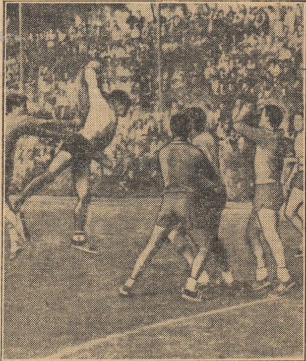
Licu încearcă să depășească, printr-un șut surpriză, apărarea formației Steua. Fază din ultimul meci Dinamo — Steua.

În cele șase întreceri ale campionatului republican de handbal se vor disputa la sfârșitul acestei săptămâni 28 de meciuri. Nu începe însă nici o îndoială că în centrul atenției iubitorilor handbalului se situează în acest final de campionat partida dintre echipele masculine STEUA și DINAMO BUCUREȘTI.