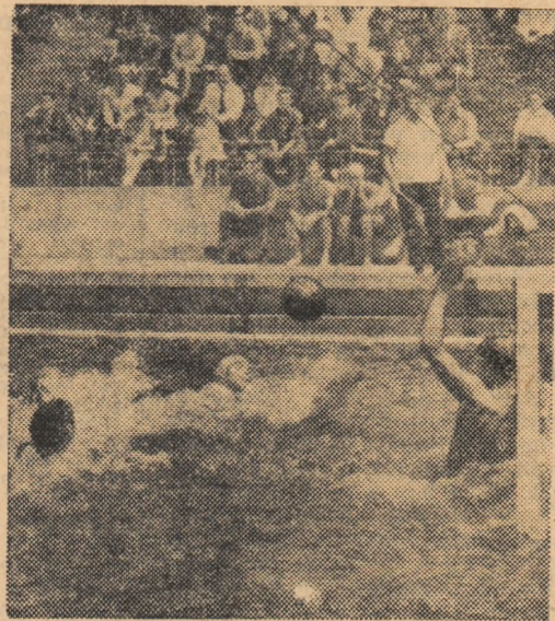
Fază din meciul Dinamo — Rapid (8-1), în care campionii finalizează un reușit contraatac

I.C.F. — CRIȘUL ORADEA 7-7 (1-1, 1-1, 2-3, 3-2). Echipa studenților de la I.C.F., promovată în acest an în prima categorie a țării, a realizat al doilea meci egal (primul săptămîna trecută în partida cu Rapid), de astă-dată în fața Crișului Oradea, formație experimentată, aflată întotdeauna printre fruntașele clasamentului. Jocul a fost echilibrat. În ultimele minute, scorul era favorabil bucureștenilor, dar o aruncare de la 4 m a adus orădenilor egalarea. Semnalăm — și sperăm că se vor lua măsuri — comportarea nesportivă a jucătorului