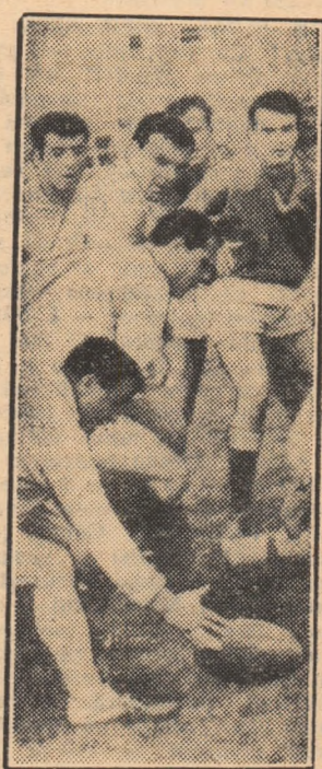
Dispută dîră pentru balonul oval... (fază din meciul Gloria București — Politehnica Iași, a cărui cronică o puteți citi în pagina a II-a).