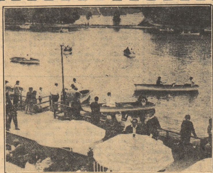
O plimbare plăcută prin parcul „23 August” o puteți face pe jos sau cu barca!

În prima jumătate a lunii iunie va evolua în țară la noi echipa de fotbal Schwaben Augsburg. Fotbaliștii din R. F. a Germaniei vor juca la Constanța, miercuri 7 iunie și la Cimpina, sîmbătă 10 iunie. Se duc tratative și pentru alte două partide.