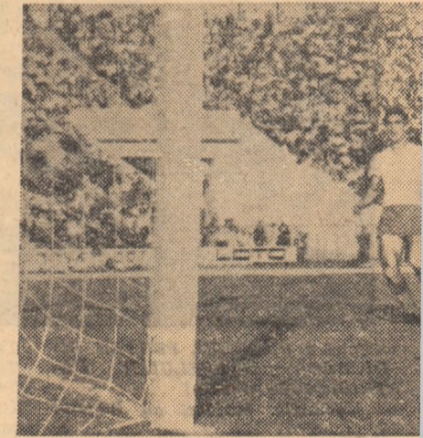
Sîtcu a fost „bătut“

Partida-vedetă programată ieri pe stadionul „23 August“ ar fi putut să-și merite titlulura. Ar fi putut, mai întii, prin prezența în teren a două echipe cu rezonanță în fotbalul nostru: Petrolul, actuala campionă a țării, și Steaua — și ea în trecut de mai multe ori cîștigătoare a campionatului categoriei A; ar fi putut, în al doilea rînd, prin faptul că meciul nu avea o miză deosebită nici pentru gazde și nici pentru oaspeți, combatanții neavînd nici „probleme de retrogradare“, dar nefiind (din păcate!) angajați nici în lupta pentru de-