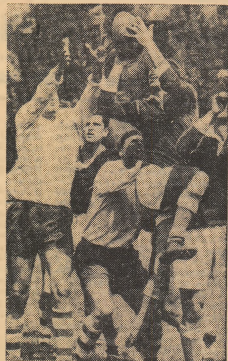
Dispută dirză pentru balon în tușă (fază din meciul Progresul—Dinamo).

Programul rugbistic constînd din trei întâlniri interbucureștene restante din etapa a VIII-a a debutat sub auspicii favorabile sîmbătă după-amiază, pe terenul Giulești. Într-adevăr, confruntarea Rapid — Grivița Roșie s-a bucurat de o vreme bună și de interesul pentru meci al ambelor echipe. A fost un joc deschis, presărat cu numeroase faze de mare spectacol și cu un număr substanțial de puncte înscrise. În final, victoria le-a revenit campionilor, care au dispus de rapidiști cu 32—11 (16—5), punctele învingătorilor fiind realizate prin 7 încercări (dintre care 4 transformate) și o lovitură de pedeapsă, iar ale învinșilor prin 2 încercări (dintre care una transformată) și o lovitură de pedeapsă.