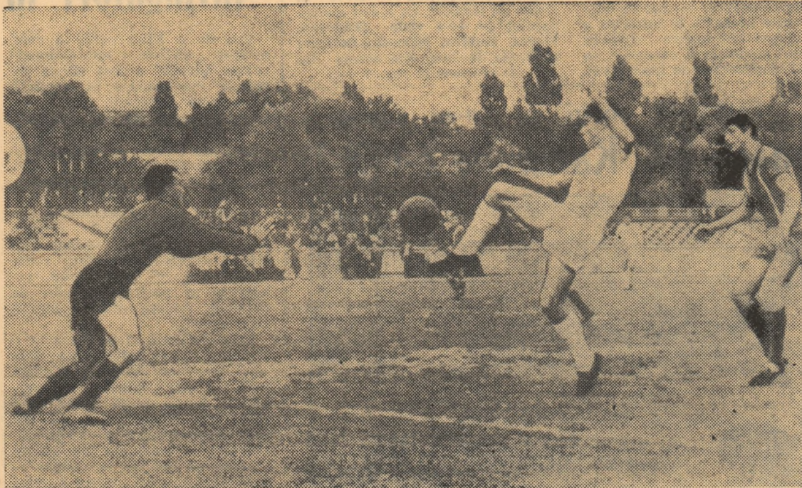
Fază din meciul de fotbal Dinamo Victoria — C.F.R. Pașcani. Atac la poarta echipei oaspete

POLITEHNICA BUCUREȘTI — POIANA CIMPINA 0-2 (0-2). Avînd terenul suspendat, fotbalistii de la Politehnică au susținut ultimul lor meci din cadrul campionatului pe stadionul Dună-