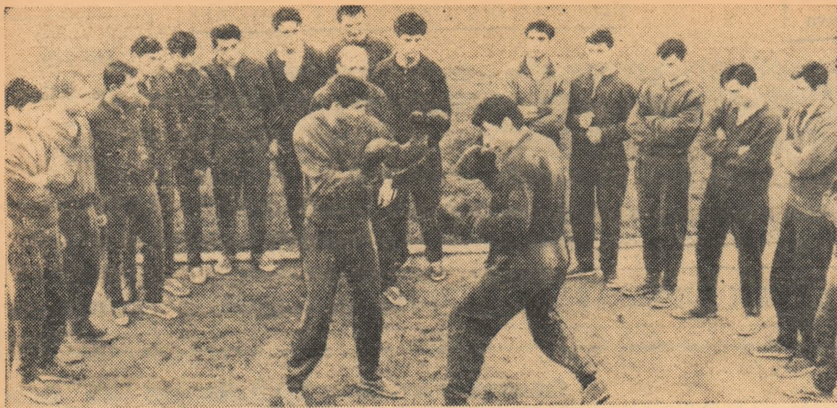
Secția de box A. S. „Metalurgistul” Cugir a împlinit de curând șase ani de activitate. În imaginea noastră „bătrînii” demonstrează începătorilor din frumusețea scrimei cu mânuși... În fiecare primăvară numărul începătorilor crește, înmulțindu-se rândurile celor ce practică acest sport la Cugir