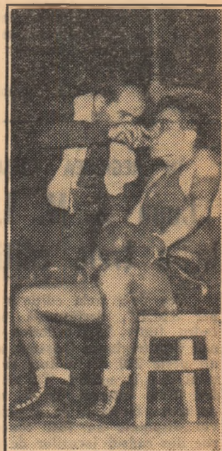
Giju cu antrenorul său, înaintea ultimei reprize...