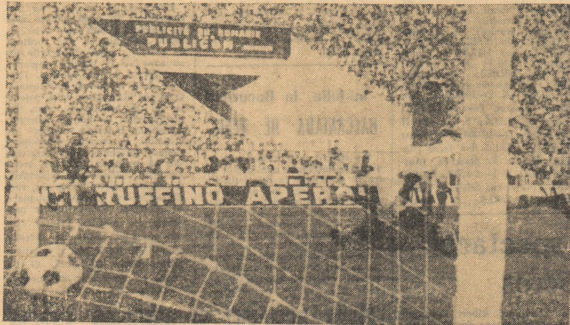
Așa s-a marcat golul care a adus victoria echipei Italiei. Autor: Bertini.