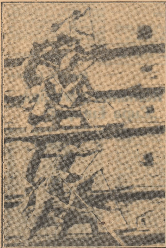
Cu un an în urmă, la cea de-a IX-a ediție a „Regatei Snagov”. Imagine din cursa canoelor de dublu