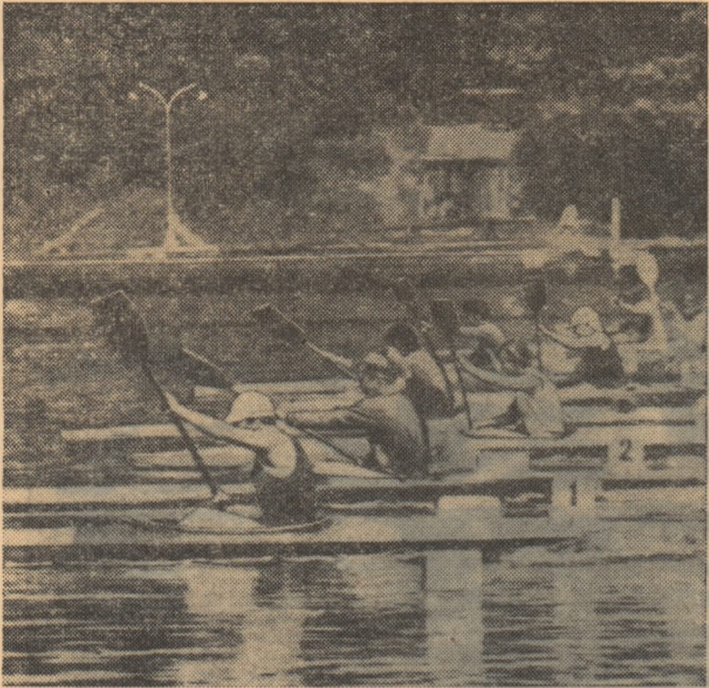
Un start în disputata probă feminină de caiac simplu 500 m.

pină pe ultima „mie”. Maxim-Simonov au condus mai bine de șapte kilometri, dar au sosit pe locul 3! (Reținem însă că Maxim n-a putut concura în plenitudinea forțelor sale fizice). Și în proba de simplu au existat incertitudini. Macarenco și Igorov au condus, pe