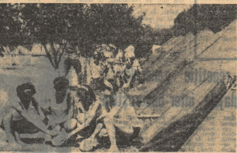
Caiac, canoa, schif, dar și... volei. Un sport complementar foarte îndrăgit, mai ales de tinerii participante la tabără.

— Cine sînt? — Juniorii de la Olimpia și unul din antrenori. Li însoțește tot timpul. Li corectează. Altfel nu se poate învăța. Noi, în schimb... — Ce vrei să spunei? — Noi trebuie să ne îndrumăm elevii de pe mal. — ? — Avem, este drept, o șalupă, nu însă și aprobarea de a o folosi. Cu toate insistențele, cu toate promisiunile, șalupa stă și acum în hangar. Așa-i că nu-i firesc? La ora 11.30 toate ambarcațiunile reîntră în... radă. Incepe programul de baie supravegheată. Elevii și profesorii, împreună. Se execută exerciții-școală pentru cazuri în care unele echipaje s-ar putea răsturna. Un caiacist, un canoist, un schifist trebuie să știe să se descurce cu ușurință în asemenea împrejurări. Și, în primul rînd, este necesar să fie un excelent înotător.