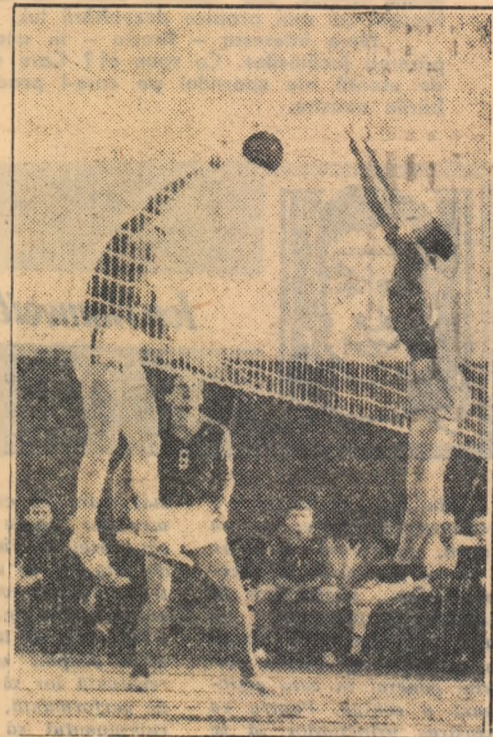
Fază din întâlnirea echipelor de volei ale Ucrainei și Kazahstanului