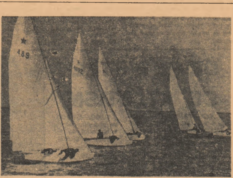
Bărcile cu pinze au intrat în toate drepturile, acum în sezonul estival; Sîntghiolul este „arena” preferată de întrecere a veliștilor. În imagine: un moment dintr-o cursă la clasa star.

La băieți, s-a resimțit întreruperea antrenamentelor din perioada în care aceștia s-au pregătit și au dat examenele de bacalaureat și de admitere în facultate. Actualmente, juniorii români se pregătesc pentru Balcaniada de la Hunedoara (23-28 august), avînd drept obiectiv intermediar turneul de la sfîrșitul acestei săptămîni (tot la Hunedoara), la care mai iau parte echipele de juniori ale Poloniei și R.D. Germane și cea de seniori a României.