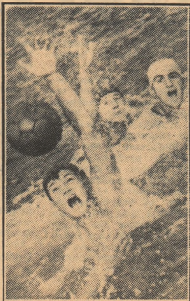
Luptă acerbă pentru balon... Fază din jocul Rapid — C. S. Școlar.