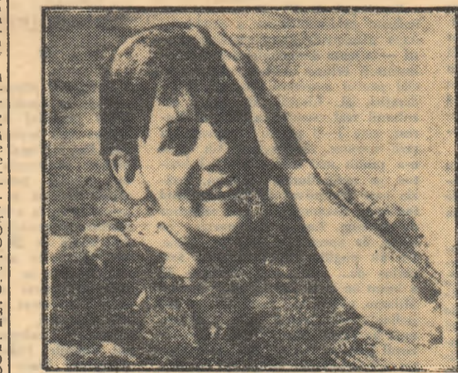
Printre performerile întrecerilor de natație din cadrul Jocurilor Panamericane și-a înscris numele și Claudia Kolb (S.U.A.), autoarea unui nou record mondial la 400 m mixt cu 5:09,7. Iat-o surprinzînd fericită...