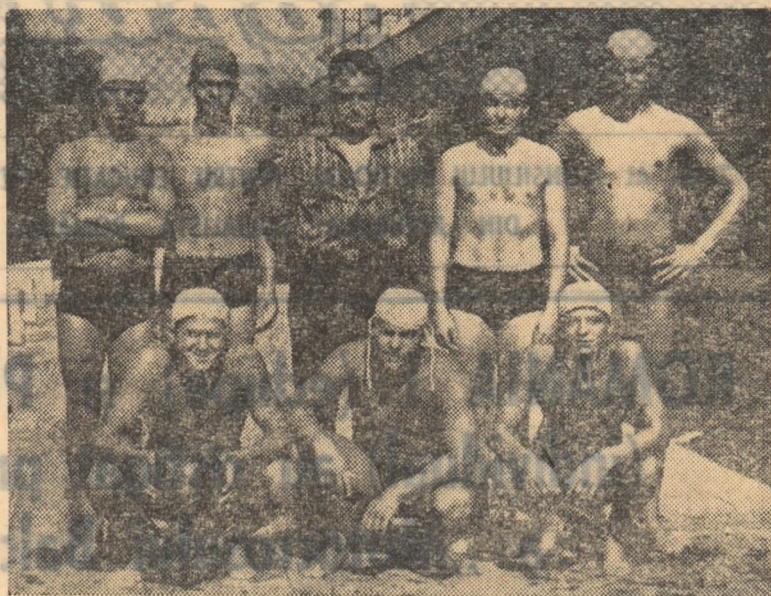
Echipa de bază a Clubului sportiv școlar, campioană pe 1967