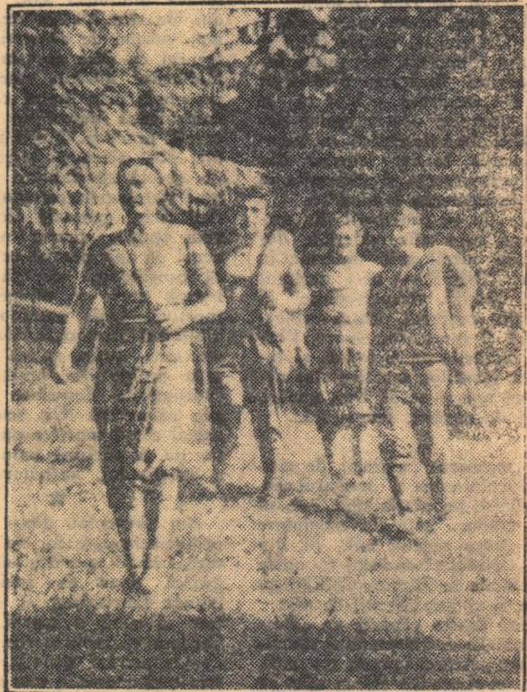
Echipa campioană, la ieșirea din tură.