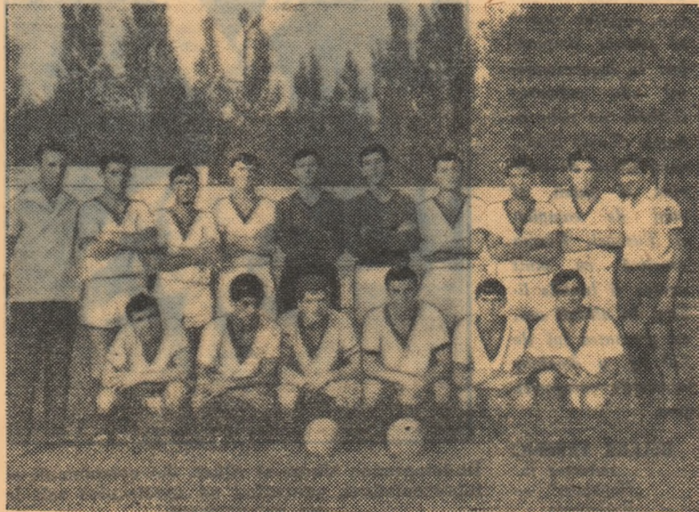
Selecionata de juniori a regiunii Brașov, participantă la Cupa F.R. Fotbal, disputată la Cîmpina