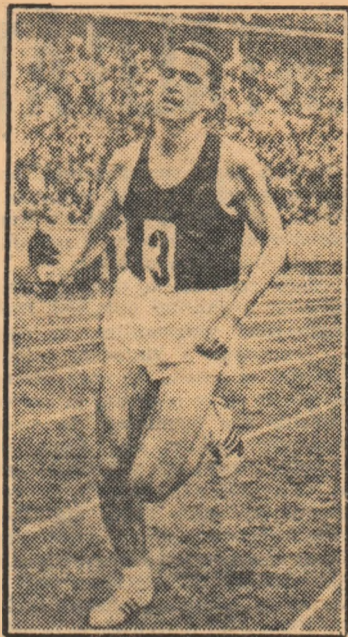
mulțumesc antrenorului Roger Bannister, care lucrează acum la Universitatea din Melbourne. El m-a ajutat la antrenamente, spunându-mi că am calități fizice încă neproaspătate.

În legătură cu planurile sale viitoare, Clarke a declarat că după ce se va antrena cu aceeași sîrguință, va încerca să doboare recordurile mondiale în probele de 10 000 m și oră „Primul meu asalt — a declarat Clarke — va fi asupra recordului orei deținut în prezent de belgianul Roelants, cu 20,664 km. Cred că voi reuși să alerg cu 120—150 m mai mult”. În ceea ce privește recordul la 10 000 m, pe care-l deține, tentativa lui Clarke se va produce în noiembrie. Apoi, Clarke a vorbit ziaristilor austrieni despre participarea sa la Jocurile Olimpice de la Ciudad de Mexico. Recordmanul mondial a arătat că el se va prezenta la startul probei de 10 000 m deoarece acum are suficientă viteză și poate răspunde atacurilor pe ultimii metri. Este problematică, însă, evoluția sa în cursa de 5000 m. Aceasta pentru că, după cum a declarat Clarke, la primul loc este „abonat” Keino. În planurile sale Clarke a mai inclus doborîrea recordului lumii la 2000 m deținut de francezul Jazy și a celui de o milă. „În proba de o milă — a încheiat Clarke — intenționez să alerg sub 3:57,0”.