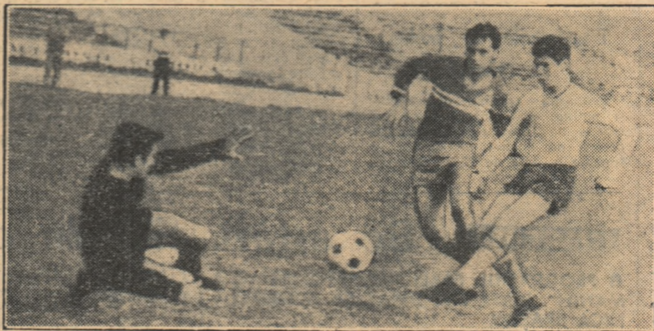
În prim plan, tînărul Dumitruc (meci de tricou alb) șteie cu șute pe lângă portarul țesit în întâmplare. (Fază dintr-un meci de pregătire în vederea confruntării de astăzi)

Confruntarea la nivel internațional, astăzi, pe trei fronturi: la București, Constanța și Viena, unde SELECȚIONATA DIVIZIONARĂ, FARUL și STEAUA se întâlnesc cu reprezentativa cluburilor din Izrael, A.E.K. și, respectiv, F. C. Austria.