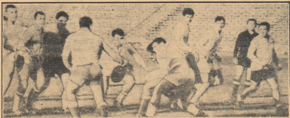
Cîteva dintre protagoniștii derbyului, în postură de... coechipieri în lotul național (fază dintr-un meci de antrenament Lotul național — Gloria).