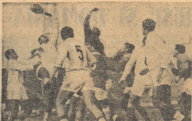
Grivița Roșie și A. S. Beziers au furnizat o splendidă luptă pentru balon, din care vă redăm faza alăturată. În alb, Grivița Roșie