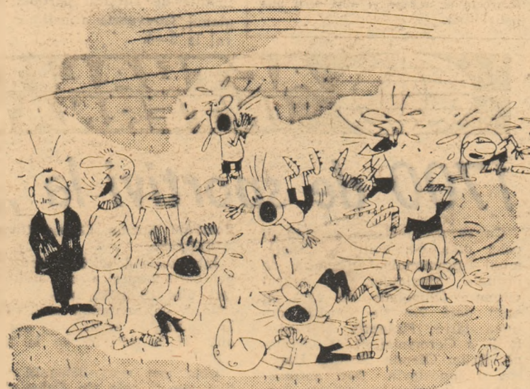
Ce te miri, azi exersăm schema tactică: „cum se poate obține o locitură de penalti”!!! Desen de ADRIAN ANDRONIC