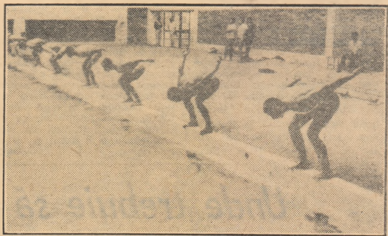
Sportivii mexicani care vor lua startul în întrecerile de pentatlon modern se autrenează asiduă la frumoasa piscină descoperită de la Centrul sportiv olimpic mexican

În cadrul aceleiași competiții, echipa portugheză Sporting a învins cu 2-1 (1-1) formația belgiană F. C. Bruges.