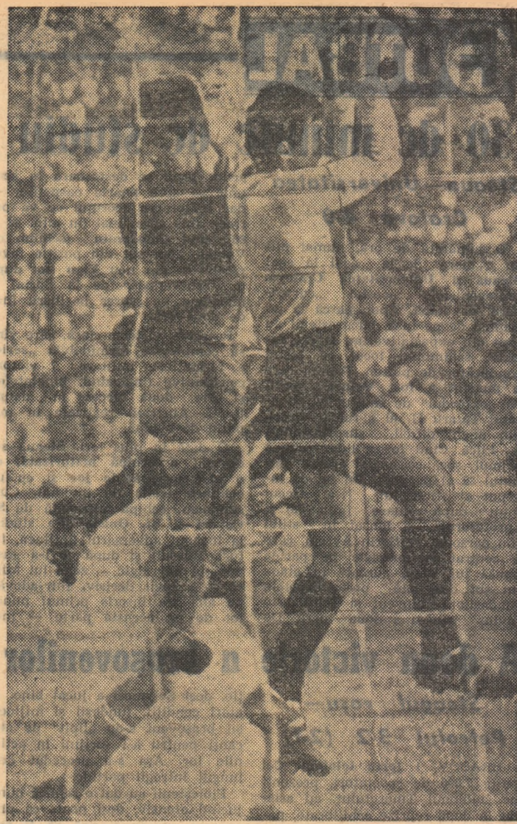
„Duel aerian” între Pilcă și Voinea (Fază din meciul Steaua—Universitatea Craiova).