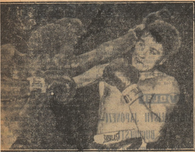
Stînga lui Griffith își atinge din nou ținta...

Timpul înregistrat de sportiva australiană este superior cu 25 de minute celei mai bune performanțe anterioare.