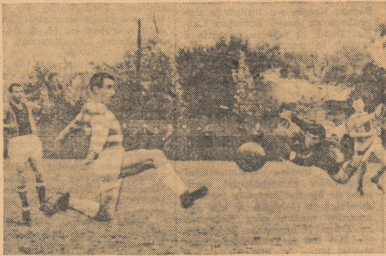
Atac al bucureștenilor la poarta Flăcării Moreni (fază din meciul Electronica Obor — Flacăra Moreni).

METALUL HUNEDOARA — C.F.R. CLUJ (1-0). Deși au cîștigat, hunedorenii au deziluzionat prin jocul practic. Oaspeții, su-