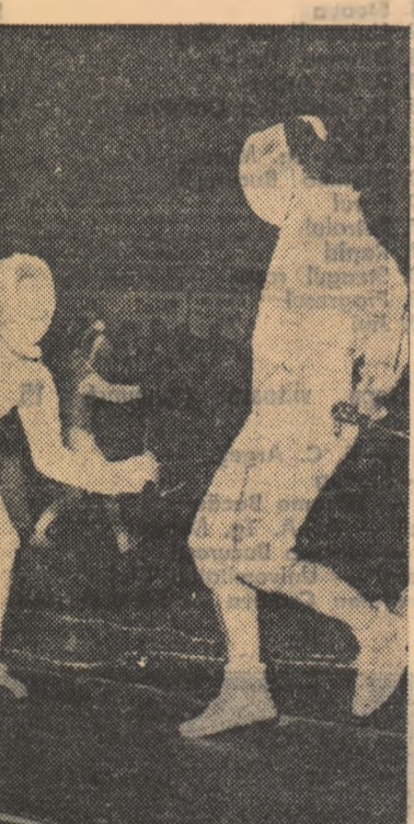
Luptă strînsă pe planșă, pentru fiecare tușă. Asemenea „faze” sperăm să vedem și cu prilejul bogatului sezon competițional care începe...

Celelalte întîlniri internaționale sint programate luna viitoare: 4 și 5 noiembrie, un turneu de