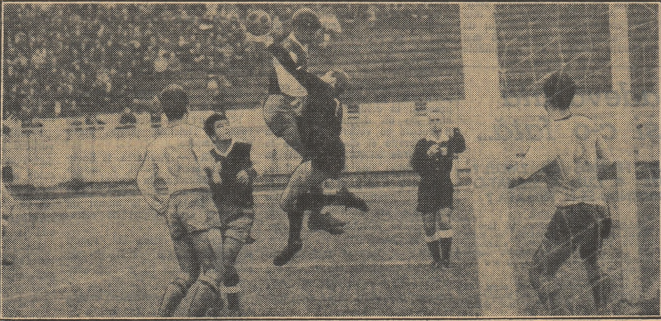
Una din puținele faze de fotbal din meciul Progresul — Petrolul