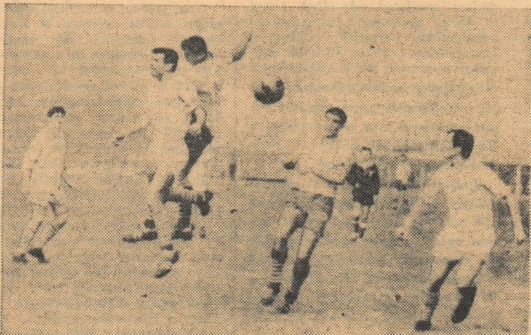
Fază din meciul Rapid C. F. București - Dunărea Giurgiu.