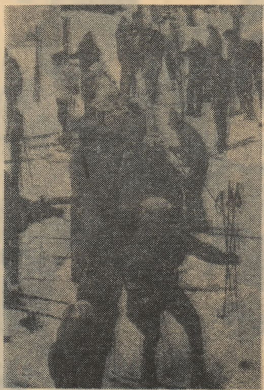
Atmosfera dinaintea concursurilor de schi o vom revedea și în această iarnă în cadrul plăcut al Poienii Brașov.

Se apropie noul sezon de iarnă. Cluburile și asociațiile cu secții de schi, hochei sau patinaj își verifică inventarul, iar sportivii se găsesc în plin antrenament. Deocamdată pe... uscat. În același timp, se fac pregătiri intense și la bazele pe care vor avea loc întrecerile.