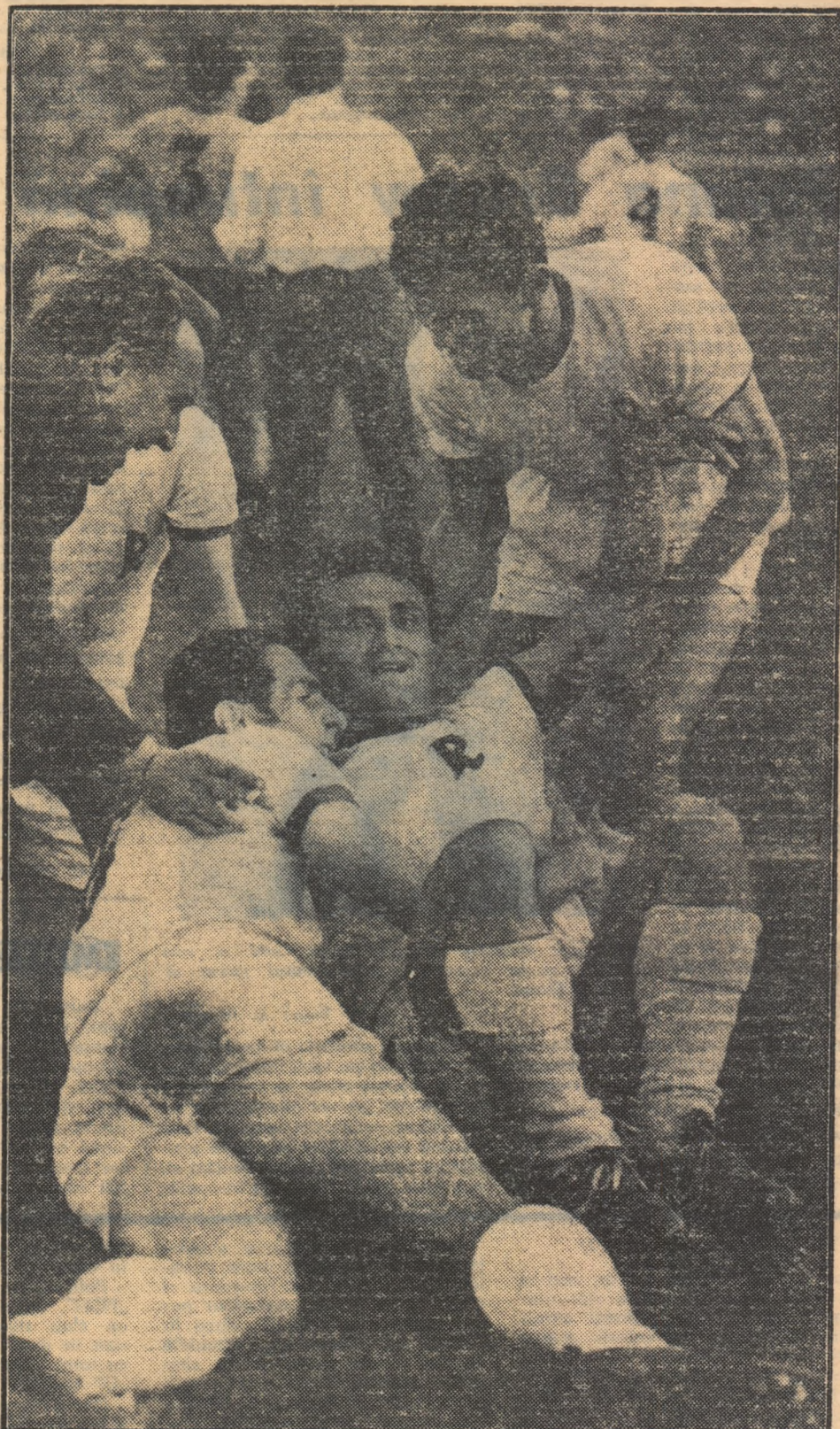
Un moment de neuitat: două secunde după golul trei!

Reprezentanții noștri sînt hotărîți să se comporte cit mai bine, pentru a-și crea „pîrtii” libere spre lotul olimpic. Trebuie știut că turneul care începe sîmbătă seara constituie un sever examen pentru cei ce aspiră la un loc în echipa care se va deplasa la Ciudad de Mexico.