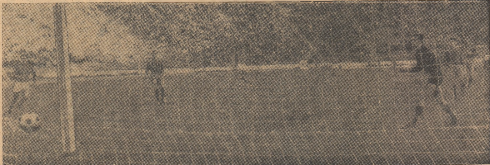
Victorie! 3—2 pentru F. C. Argeș de la 0—2.

(Citiți în pag. 2—3 cronicile meciurilor din etapa a X-a)