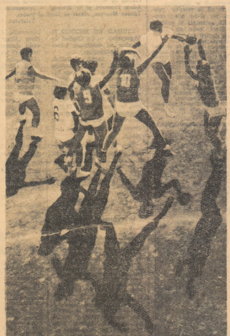
Lumini și umbre... Fază din jocul Universitatea București — Universitatea Timișoara

SERIA A II-a: masculin: Universitatea Craiova — Știința Petroșeni 20-7 (7-3); Politehnica II Timișoara — Timișul Lugoj 14-14 (8-8); Universitatea Timișoara — I.C.O. Arad 15-23 (5-11); Metalul Copșa Mică — Știința Lovrin 17-9 (9-3); Tehnometal Timișoara — Medicina Tg. Mureș 19-17 (10-7); feminin: Constructorul Baia Mare — Voința Odorhei 7-14 (2-7); Universitatea Cluj — Știința Economică București 19-5 (8-2); Șc. sp. Petroșeni — Universitatea II Timișoara 9-9 (4-5); Universitatea II București — C.S.M. Sibiu 5-13 (3-5).