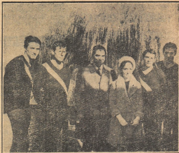
Printul Gholam Reza Pahlavi și prințesa Manigé la Snagov, în mijlocul canotorilor români