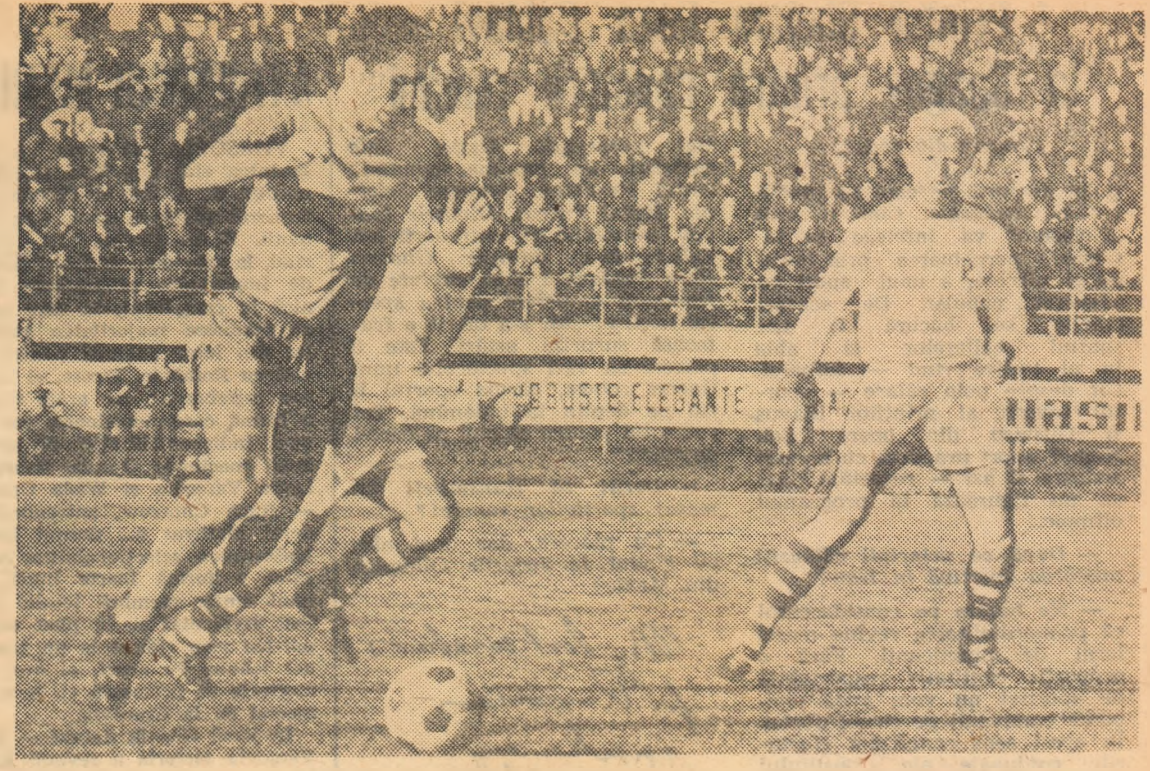
Dridea conduce balonul, sub privirile rapidiștilor Dinu și Bungău. O nouă acțiune care se va opri, ca și celelalte, la marginea careului de 16 m.