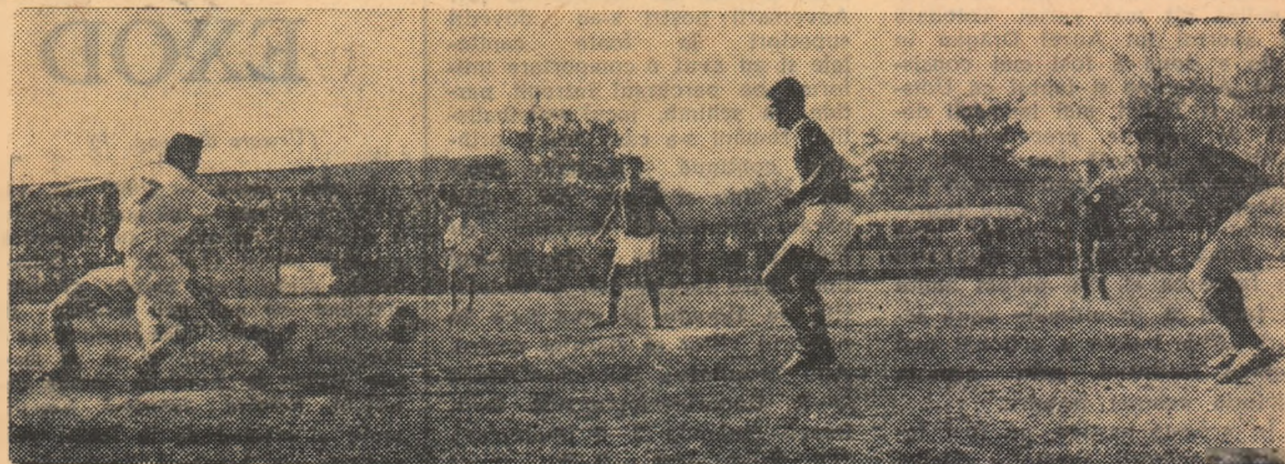
În etapa de duminică, spectatorii prezenți la partida dintre Metalul Buzău și Flacăra Moreni din „Cupa României” au asistat la un adevărat maraton fotbalistic încheiat după cele 120 de minute la egalitate: 1-1. Iată o fază din acest meci, surprinsă de corespondentul nostru Ion Popescu.