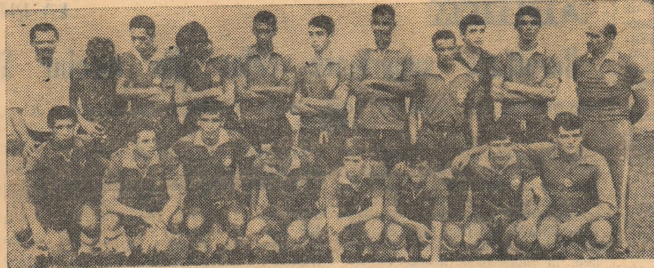
O fotografie de... prezentare a selecționatei statului Sao Paulo

Fotbaliștii brazilieni vor susține în România două jocuri programate pentru 7 și 9 noiembrie. Ei vor înfrîna două selecționate românești, aflate în pregătire pentru meciurile cu R. F. a Germaniei.