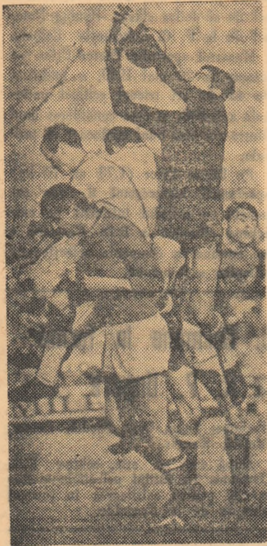
Fază din meciul F. C. Argeș — F.C. Karl Marx Stadt, disputat în R. D. Germană. (Rezultat: 1-0 pentru Karl Marx Stadt)

PITEȘTI, 8 (prin telefon). — Deși amicală, partida dintre echipele F. C. Argeș și F. C. Karl Marx Stadt a îmbrăcat de la primele minute caracterul unei dispute oficiale. Acest lucru s-a văzut din dinamismul imprimat jocului și, mai ales, din insistența cu care ambele formații au creat feze de gol sau acțiuni rapide