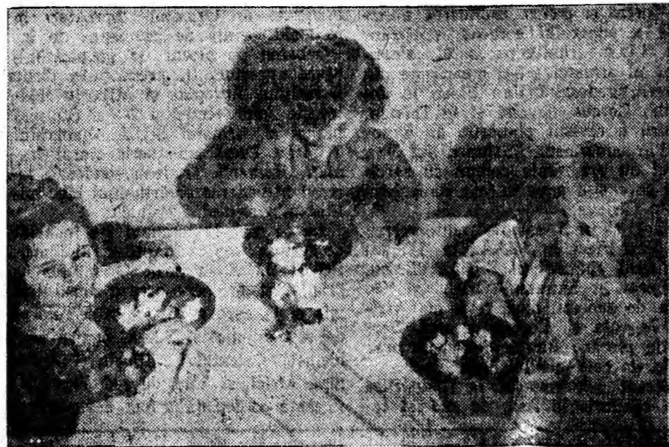
După orele de povești, de joacă masa e bine venită

Ceea ce-ți atrage foarte mult atenția cînd intri în acest cămin, sînt tablourile pictate în culori vii care