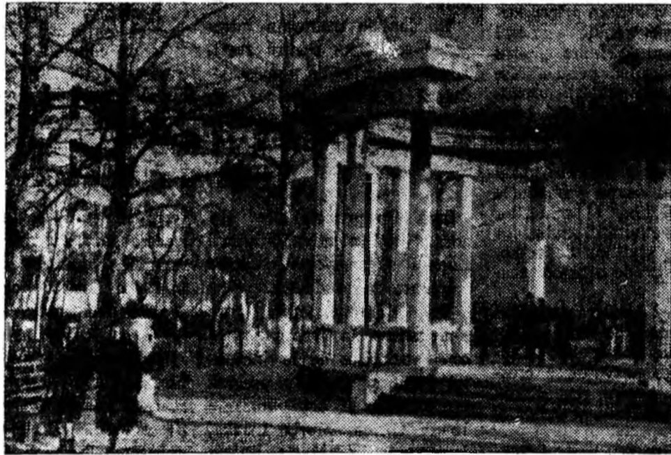
IN CLIȘEU: Scurul „Minerul” de la Stalinogorsk, locul de odihnă al muncitorilor mineri

În prezent, colectivul uzinei „Stalin” face pregătiri în vederea conferinței tehnice pe întreaga uzină. Comisiile create în fiecare secție strîng propunerile metalurgiștilor pe baza cărora se elaborează măsurile în vederea îmbunătățirii organizării muncii, automatizării și mecanizării producției.