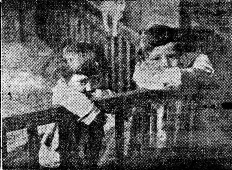
La grădinița din Petroșani și creșa din orașul Petrila, copiii oamenilor muncii se bucură de o grijă deosebită în timpul cînd părinții lor sînt la lucru