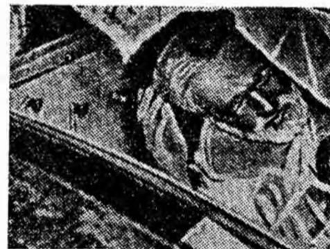
Acest șomer din Chicago este nevoit să-și petreacă noaptea în cabina unui automobil stricat.