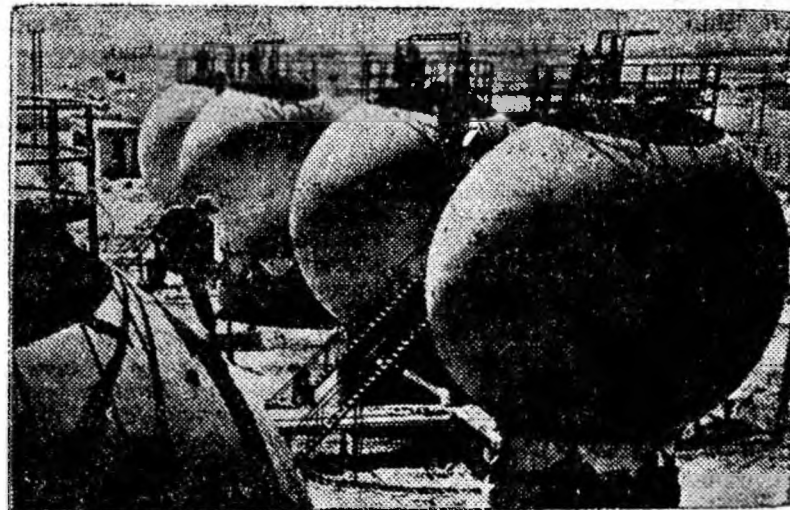
În orașul Șumgait din Azerbaidjean a fost construită o uzină de cauciuc sintetic. Aceste stere sînt rezervoarele în care se depozitează gazul butan necesar producției.

În anii septenalului în Donbasul apusean, pe teritoriile regiunii economice Dnepropetrovsk vor fi date în exploatare 30 de mine. (Agerpres)