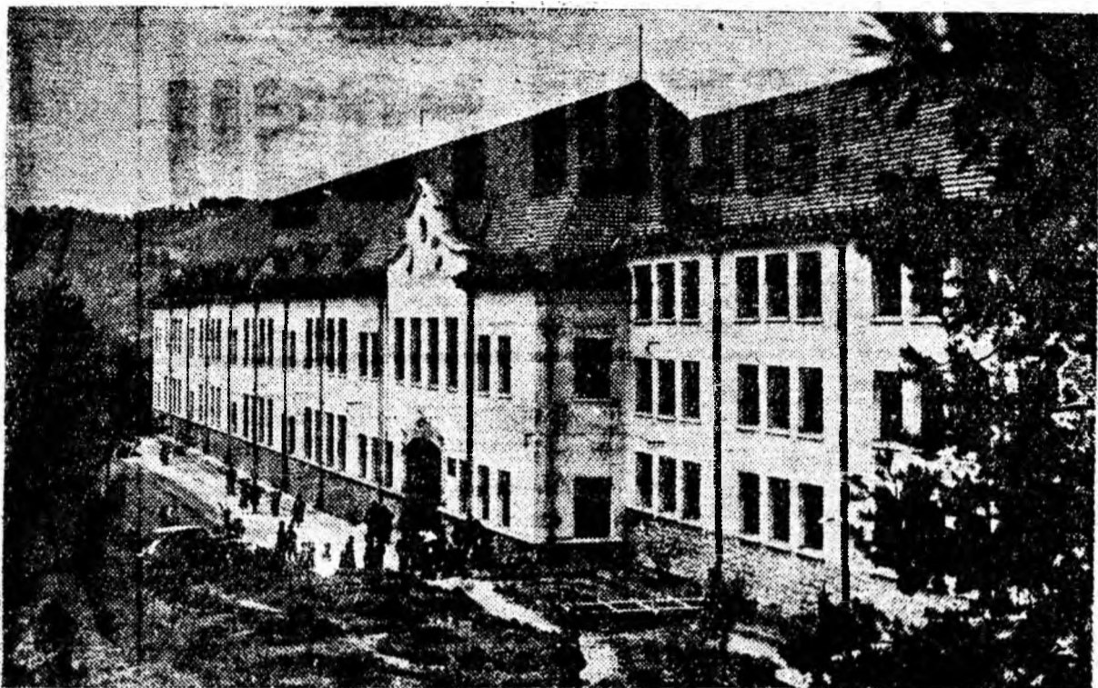
Institutul de mine din Petroșani

...Au sunat timid, la poarta mare a cetății științei, 59 de copii. Erau curioși să cunoască tainele curții și ale cetății atât de neprimitoare pînă atunci și care ascundea comoara culturii. Marele străjer al istoriei a înălțat în acel an de neuitat zăvoarele și le-a făcut un semn primitor, să intre. Și micuții au rămas uimiți la priveliștea înălțată a ochilor. Parcă-i văd și acum.