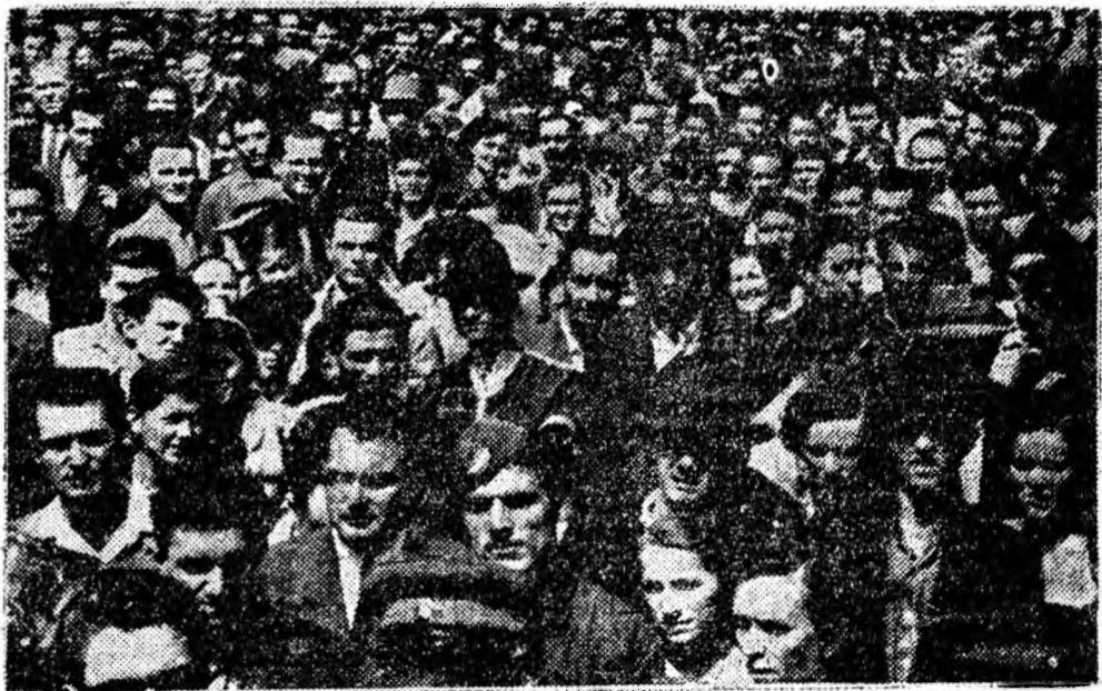
Un aspect de la sfîrșitul demonstrației. Mii de oameni în fața tribunei