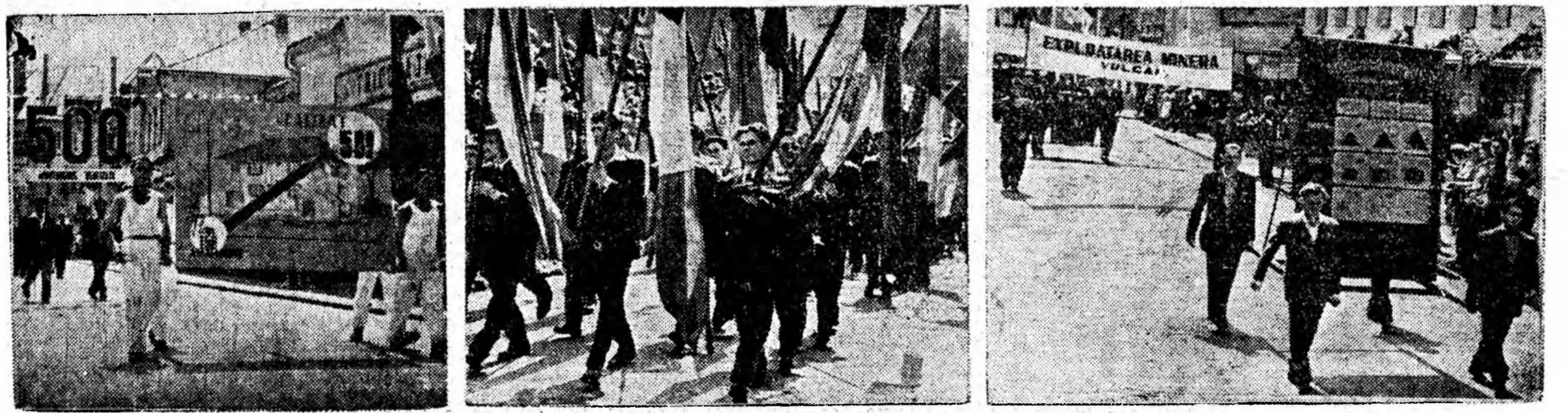
Aspecte de la demonstrația din Petroșani a oamenilor muncii din Valea Jiului.