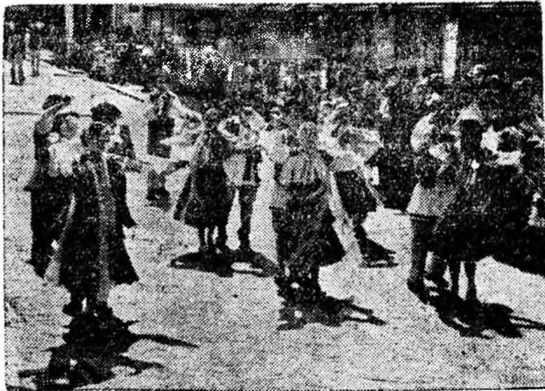
Una din formațiile de dansuri, în fața tribunei.

Alături de mineri au trecut prin fața tribunei, muncitorii preparației din Lupeni. Ei au raportat că în cinstea zilei de 23 August au pus în funcțiune o nouă linie de flotație mecanică cu ajutorul căreia vor obține însemnate economii de materiale, vor mări recuperarea în cărbunele special.