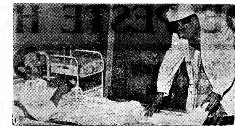
La Lonea funcționează un staționar, cu personal sanitar bine pregătit gata oricînd să dea îngrijirea necesară bolnavilor inter-nați.

Insufleții de acest stimulent, tinerii muncitori de la sectorul IX al minei Lupeni s-au angajat