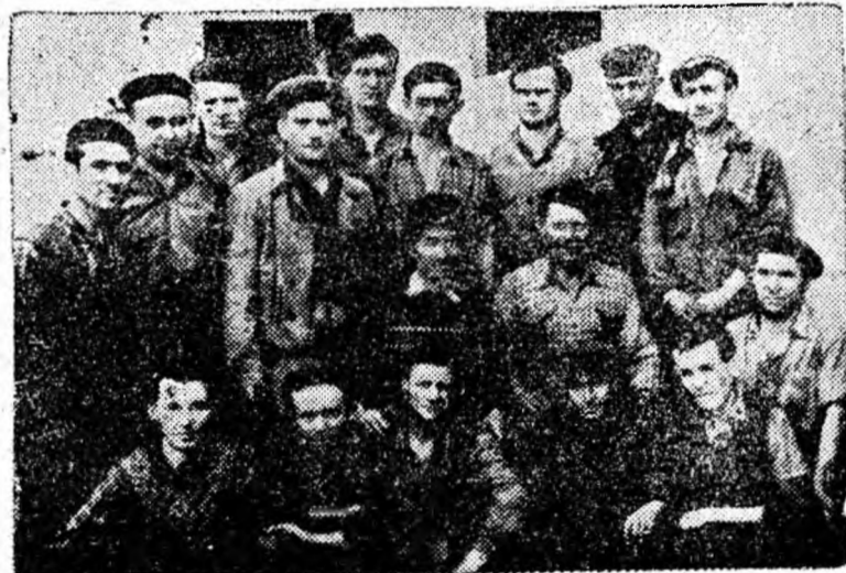
Grupul de muncitori care a participat la amenajarea aleii.

O contribuție însemnată la infrumusețarea localității Lonea aduce și colectivul sectorului IX electromecanic al minei. Acest colectiv a amenajat în ultimele săptămîni o alee care leagă gara Lonea de cartierul Gheorghe Gheorghiu-Dej. Muncitorii de la atelierul electromecanic au confecționat pentru alee și o balustradă de 150 metri, efectuînd în total peste 2700 ore muncă voluntară.