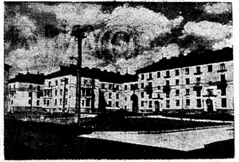
Blocuri noi, moderne, cu multe etaje, alei asfaltate, ronduri cu flori și verdețuri care-ți încântă ochiul. Acesta este cartierul Gh. Dimitrov din Petroșani, construit în anii puterii populare.