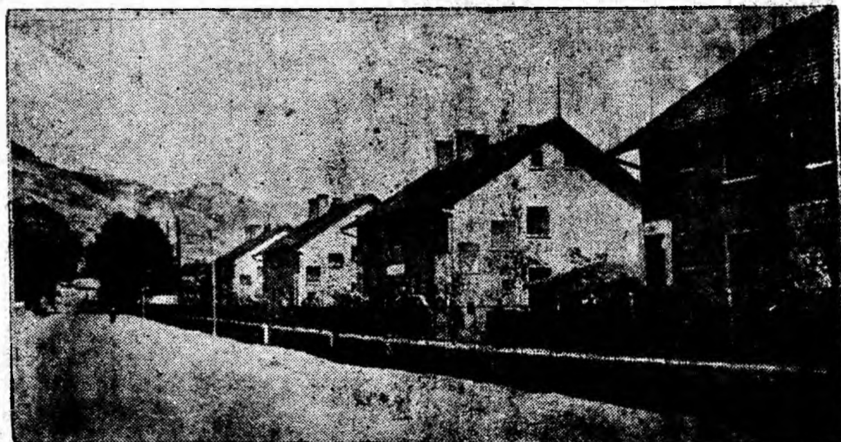
Acum cîtiva ani la marginea dinspre Petroșani a Petriței era un teren viran, năpădit de hălări. În anii puterii populare aici s-au construit cîteva blocuri cu locuințe. După construcția blocurilor mereu s-a făcut cîte ceva: s-a amenajat terenul dintre blocuri, s-a construit un frumos gard de împrejmuire, s-au plantat arbori, iar șoseaua a fost asfaltată. Astăzi, pe fostul teren viran găsești un frumos cartier de locuințe.