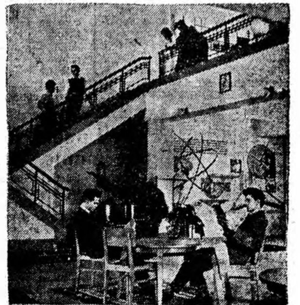
Vedere din interiorul Casei de cultură a studenților „Grigore Preoteasa”.