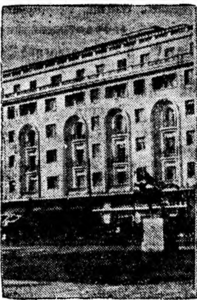
Athenee Palace — vedere parțială.

cialiști în toate ramurile de activitate. Orașul posedă cele mai variate întreprinderi industriale metalurgice în care sînt reprezentate aproape toate ramurile acestor industrii.