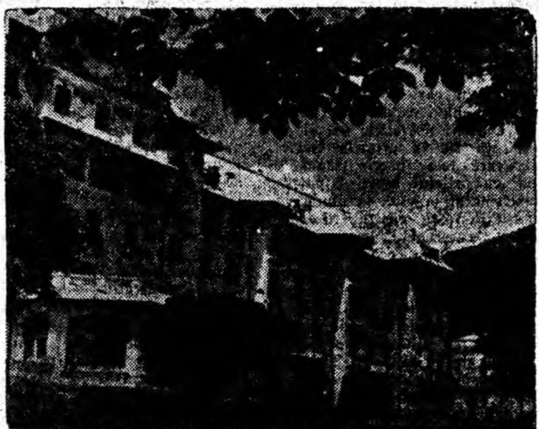
Sînta — Casa de odihnă „Postăvarul”.