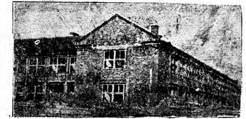
Copiii din Paroșeni vor avea în curînd o școală nouă chiar în mijlocul „orașului” lor, ridicat și el în ultimii ani. La noua școală se lucrează în prezent la finisările interioarelor celor 8 săli de clasă, o sală de lucrări manuale și a celor două laboratoare.

IN CLIȘEU: Vedere exterioară a noii școli în construcție din Paroșeni.