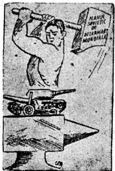
Desen din revista „Timpuri noi”